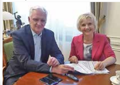
Spotkanie z Wicepremierem Jarosławem Gowinem