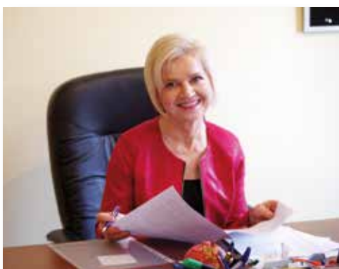
Pani Senator w pracy