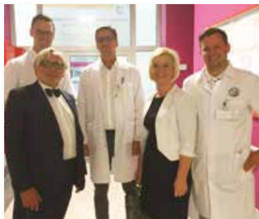
Wizyta w Szpitalu Uniwersyteckim w Olsztynie