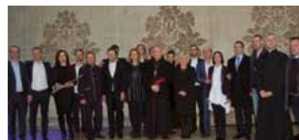
Uroczystości 3 Maja