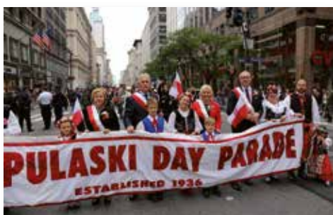
Parada Pułaskiego na Manhattanie, USA