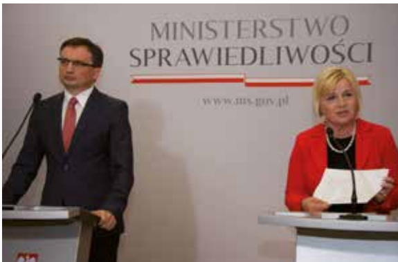
Minister Sprawiedliwości Zbigniew Ziobro i Senator Lidia Staroń podczas konferencji dotyczącej lichwy