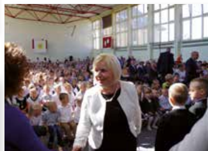
Wojewódzka Inauguracja Roku Szkolnego 2016/17