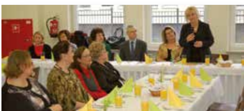
Spotkanie wielkanocne dla mieszkańców osiedla Kormoran