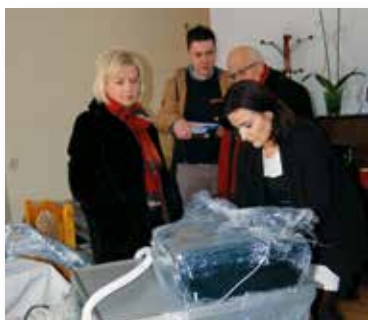
Rozpakowywanie sprzętu zwróconego przez komornika