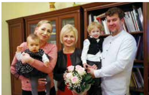
Skończył się koszmar rodziny. Nie zabiorą im mieszkania!