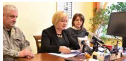
Konferencja z udziałem olsztyńskich spółdzielców