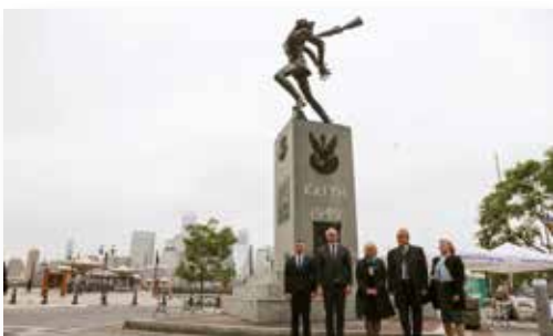
Złożenie kwiatów pod pomnikiem upamiętniającym Zbrodnię katyńską, USA