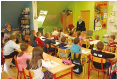
Wizyta w szkole w Tuławkach