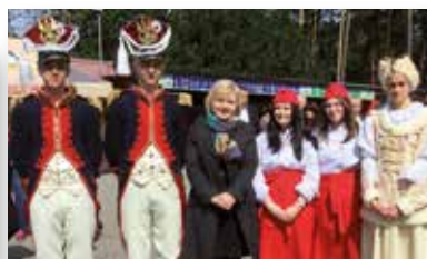
Wiosenne Targi Ogrodnicze