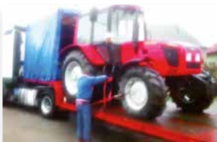
Ciągnik zabrany przez komornika za długi... sąsiada i... nowy