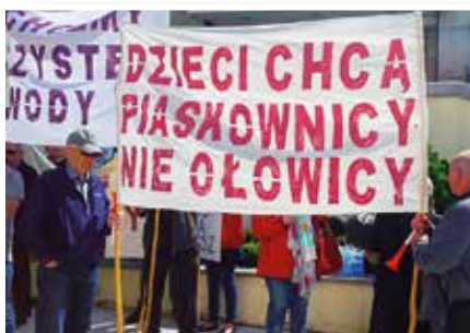
Protest mieszkańców Korsz

w czerwcu 2019 r. były dyrektor Zakładu został prawomocnie skazany za dopuszczenie do zanieczyszczenia ziemi, wody i powietrza , które mogło stworzyć zagrożenie dla zdrowia ludzi! Sławomir W. musi zapłacić grzywnę i nawiązkę (50 tys. zł). Od 1 lipca 2019 r. Zakład zaprzestał produkcji na czas nieokreślony!