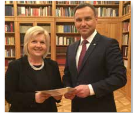
Senator Lidia Staroń z Andrzejem Dudą Prezydentem RP

Zmiany znalazły się w prezydenckim projekcie ustawy o Sądzie Najwyższym.