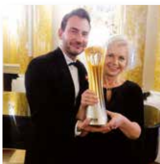
100-lecie odzyskania niepodległości – z pucharem Mistrzostw Świata w Piłce Siatkowej Mężczyzn 2018