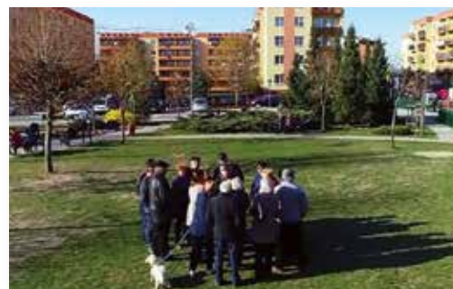
Dzięki Pani Senator spółdzielnia już nie może wyłudzić nienależnych opłat (Interwencja, Polsat)