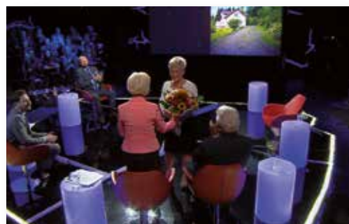
Państwo w Państwie, Polsat