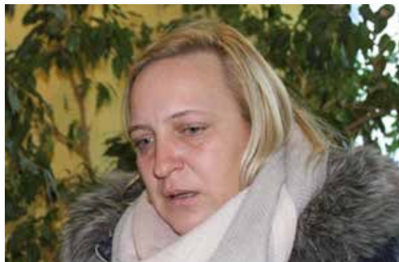
Zrozpaczona matka pięciorga dzieci walczy o sprawiedliwość. Wspiera ją Senator Lidia Staroń (Państwo w Państwie, Polsat)

Pani Beata: „Pani Senator jest „małym” człowiekiem tworzącym WIELKI cień. Kobieta silna, szlachetna, dobra oddana służbie społeczeństwu, która poza pozycją ma serce i duszę, która pamięta, że nie stanowisko a ludzie budują opinię publiczną. Nie słowa, a czyny budują szacunek. Senator, który w ramach możliwości prostuje pokręcone ludzkie losy... Bezkonkurencyjny diament polityczny, aż przykro, że jedyny tak zaangażowany i oddany ludzkości...”