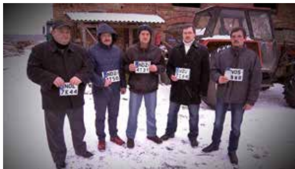
Poszkodowani rolnicy

Po interwencji Pani Senator wszczęto postępowanie karne. Na majątku producenta ustanowiono zabezpieczenie! Postawiono zarzuty dilerowi i producentowi!