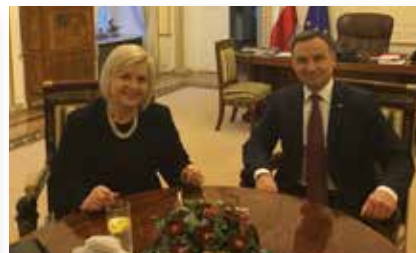
Spotkanie z Prezydentem RP Andrzejem Dudą