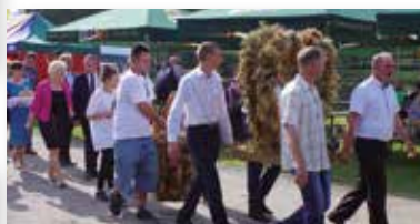
Dożynki Nidzica Dożynki Janowiec Kościelny