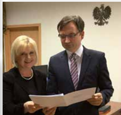
Spotkanie z Ministrem Sprawiedliwości Zbigniewem Ziobrą w sprawie zmiany przepisów