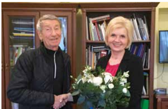
Wygrana batalia z komornikiem i ubezpieczycielem! Muszą oddać pieniądze!