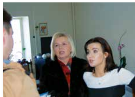
Burzliwa rozmowa z komornikiem