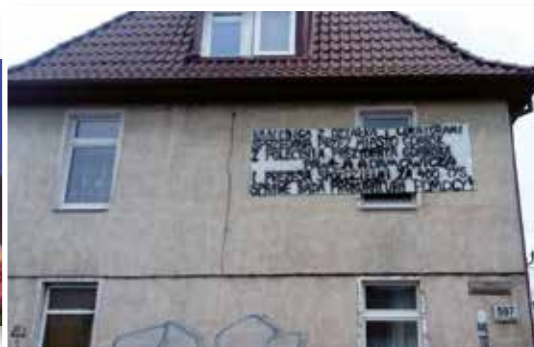
Kamienica a na niej – rozpaczliwy apel mieszkańców