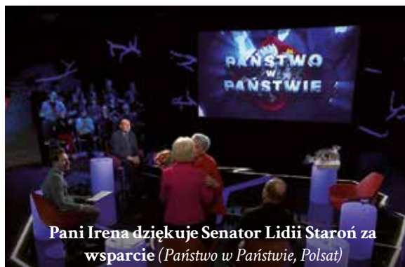
Pani Irena dziękuje Senator Lidii Staroń za wsparcie (Państwo w Państwie, Polsat)

Pani Irena długo szukała sprawiedliwości po tragicznej śmierci syna... Waldemar, chory na schizofrenię, zginął pod kołami pociągu, bo pielęgniarka (alkoholiczka) wypuściła go z zamkniętego szpitala... na zakupy. Chociaż zaniedbania szpitala były ewidentne, nikt nie poczuwał się do winy. Po 4 latach, dzięki pomocy Senator Lidii Staroń – zapadł wyrok skazujący!