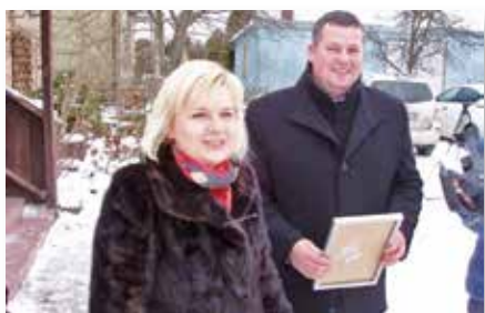
Wygraliśmy! Już jest – nowy ciągnik!