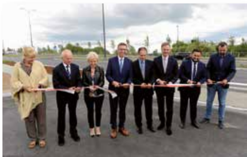
Uroczyste otwarcie ul. Towarowej w Olsztynie