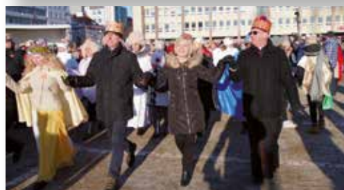
Święto Trzech Króli