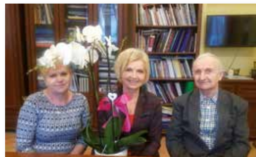
Wspólnota Mieszkaniowa może wreszcie remontować swój budynek

Członkowie Wspólnoty Mieszkaniowej w Olsztynie, po latach bezskutecznej walki z urzędnikami, dzięki interwencji Senator Staroń, uzyskali zgodę na remont zdewastowanego budynku, znajdującego się wcześniej w gminnej ewidencji zabytków. Mieszkańcy zaczęli długo wyczekiwany remont!