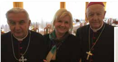
Z Arcybiskupami Seniorami: Edmundem Piszczem i Wojciechem Ziembą i z Kardynałem Kazimierzem Nyczem (spotkanie w Wyższym Seminarium Duchownym w Olsztynie)