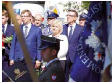
Rocznica wybuchu II wojny światowej