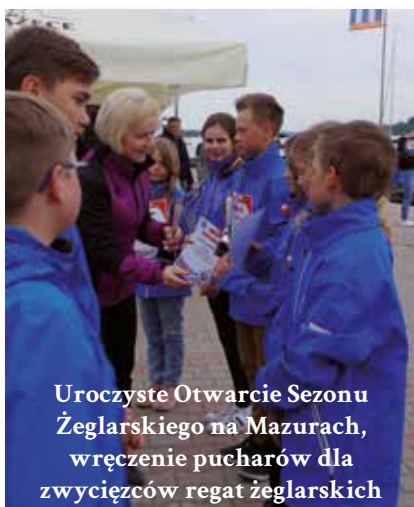
Uroczyste Otwarcie Sezonu Żeglarskiego na Mazurach, wręczenie pucharów dla zwycięzców regat żeglarskich