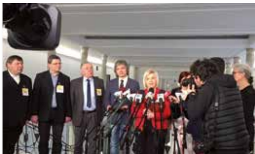
Konferencja w Sejmie z udziałem spółdzielców